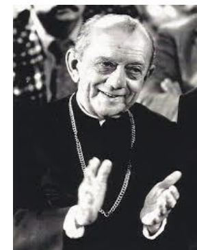
Profeta Mons Helder Cámara (+)