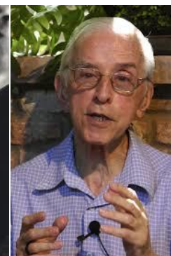
Profeta, Mons Casaldáliga